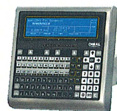
устройство обработки измерительной информации с показывающим устройством и клавиатурой управления

WL4000 (для использования как в качестве самостоятельных устройств)