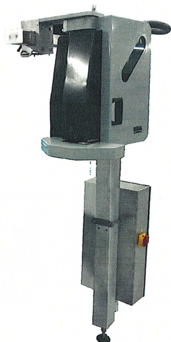
Печатающее устройство и электрический шкаф