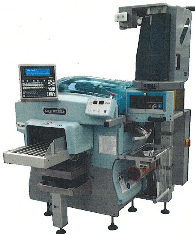
WL4000 (в составе упаковочной машины)